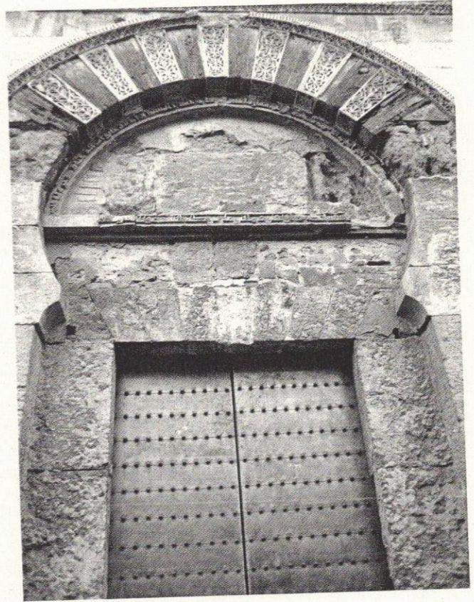
Mezquita de Córdoba

Es poco lo que se sabe de su juventud, salvo que debió de ser no mucho religiosa, según confiesa él mismo cuando afirma que, llegado a los veintiséis años, no era capaz siquiera de realizar la oración en la mezquita sin llamar la atención por su torpeza y desmanejo del rito 21 . Ello avala, además, su mayoría de edad, tan ascética y devota, común entre quienes no han escarmentado tras vadear las aguas muertas de una infancia atenazada por la religión. Algunas de las contradicciones observables en El Collar de la paloma —entre los primeros capítulos, que parecen sugerir una juventud disipada y un concepto más bien laxo del pecado, y los últimos, especialmente los dos que cierran el libro, tan inflexiblemente ortodoxos y rígidos en lo vital— también apuntan en esa dirección. En cualquier caso, es una juventud que coincide con el agotamiento del poder califal, incapaz de poner orden en las ambiciones de un paisaje que ha devenido demasiado heterogéneo como para ser apacentado con disciplina ni de proponer, como dijera siglos después Ortega 22 , un «proyecto sugestivo de vida en común» (permítaseme la traspolación, tan diacrónica como irresistible) a una civilización como la hispanoárabe, que no fue más que un esqueje exótico que, tras agarrar milagrosamente en un terreno al que siempre fue ajeno, empezaba entonces a amustarse, incapaz de sobrellevar la presión irresistible de una cristiandad que, al contrario